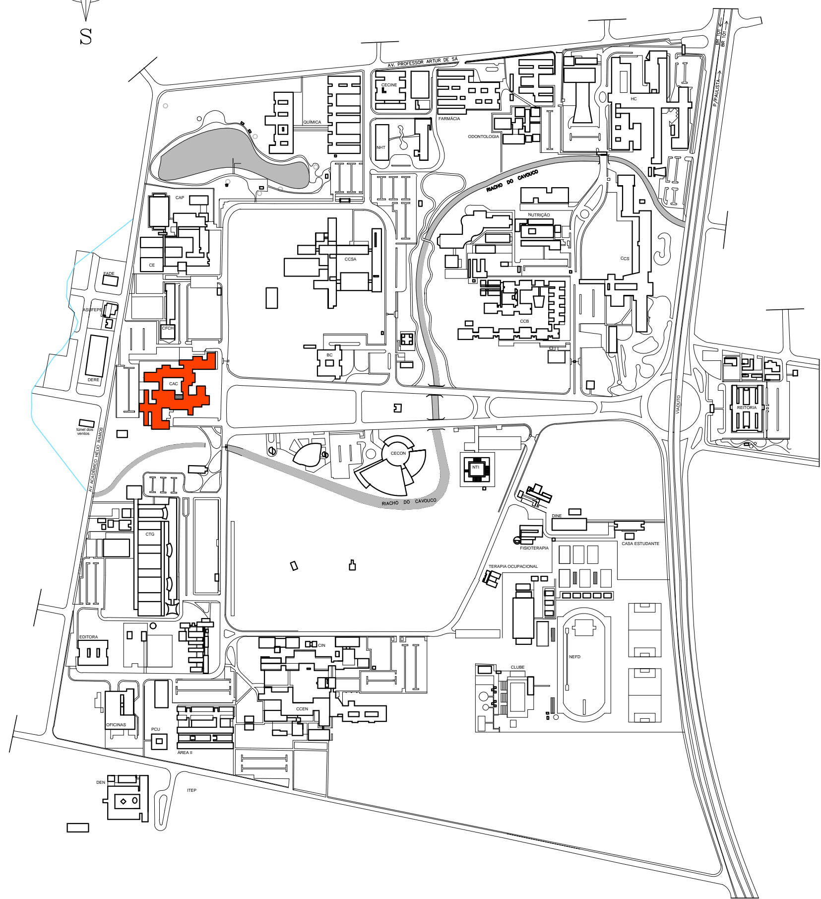
1 PLANTA DE SITUAÇÃO SEM ESCALA